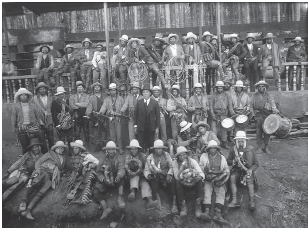
Q' Orillas de Chumbivilcas 1944