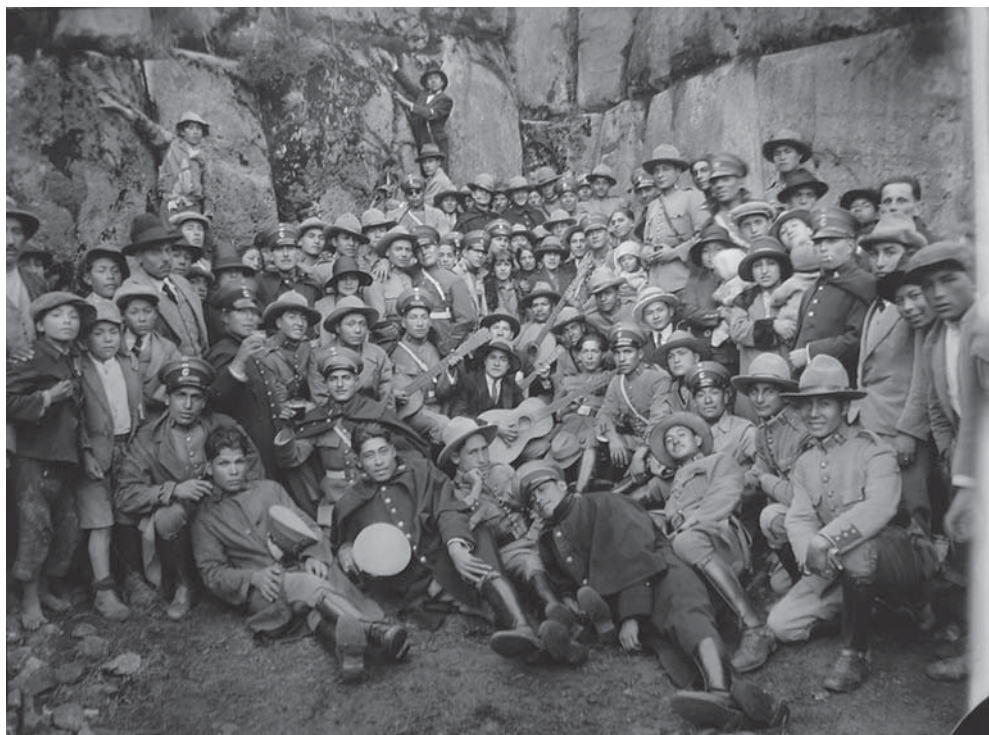
Guardias civiles en Sacaywaman 1928