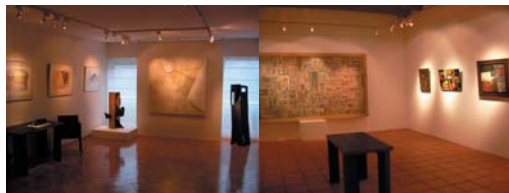
GALERIA SUR Montevideo

Tapa: Organista en la capilla de Tinta, Canchis 1935 Contratapa: Piedra de los doce ángulos, Cuzco 1930