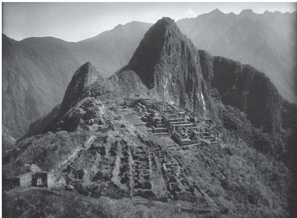
Ciudadela de Machu Pichu 1925