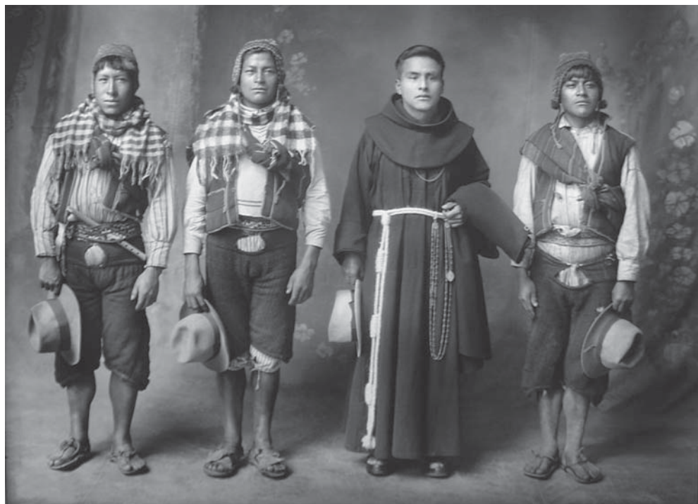
El hermano cura Cuzco, 1933