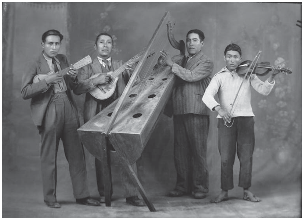
Músicos populares Cuzco, 1934